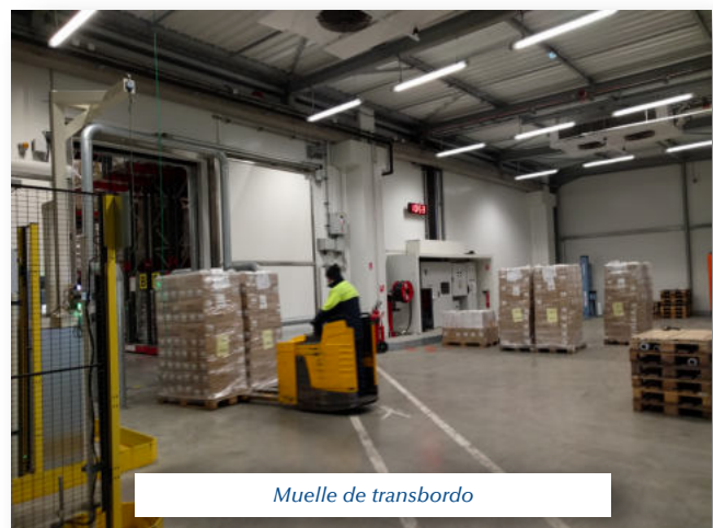
Muelle de transbordo