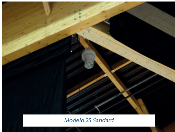
Modelo 25 Sandard